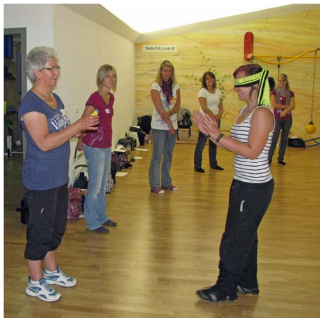
Foto oben: Konzentriert hören und auf die Geräuschquelle zugehen (Melle).

Bildung – Bewegung – Gesundheit sind zentrale Themen bei der Arbeit in Kindertagesstätten. Allerdings sind diese im Kita-Alltag oft noch nicht so verknüpft bzw. stehen nebeneinander. Dabei sind Bewegung und Wahrnehmung für Kinder der Zugang zu sich selbst und der Welt. Bewegung bildet und ist für die Gesundheit von Kindern unabdingbar. Diese engen Wechselwirkungen wurden in den Fachtagungen in Melle und Schifferstadt aufgezeigt. Unterstützt wurden diese Fachtagungen durch die Bertelsmann Stiftung ( www.gute-gesunde-Kita.de ), die mit dem Konzept der guten gesunden Kita die Bildungs- und Gesundheitschancen von Kindern verbessern will.