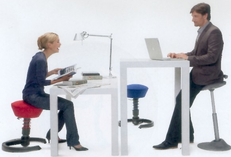
Sitz-Stehhilfen ermöglichen vielseitige Haltungenwechsel. Empfehlenswert sind vor allem solche, die Sitzpositionen in verschiedenen Höhen zulassen.

uns bewusst wird, zu handeln. Sichtbar wird diese selbst-regulative Fähigkeit beispielsweise bei einem frei stehenden Menschen und seinem komplexen, unbewussten Belastungswechsel zwischen Spielbein und Standbein.