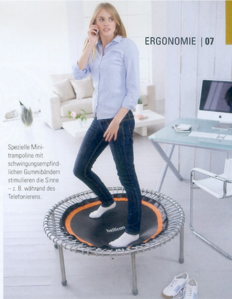
Spezielle Mini-trampoline mit schwingungsempfindlichen Gummibändern stimulieren die Sinne – z. B. während des Telefonierens.

Der Arbeitsstuhl wird trotz aller mahnenden Hinweise, dass wir für das längere Sitzen nicht geschaffen sind, auch in Zukunft eine dominante Rolle einnehmen. Gerade deshalb ist es wichtig, die üblicherweise auf biomechanischen An-